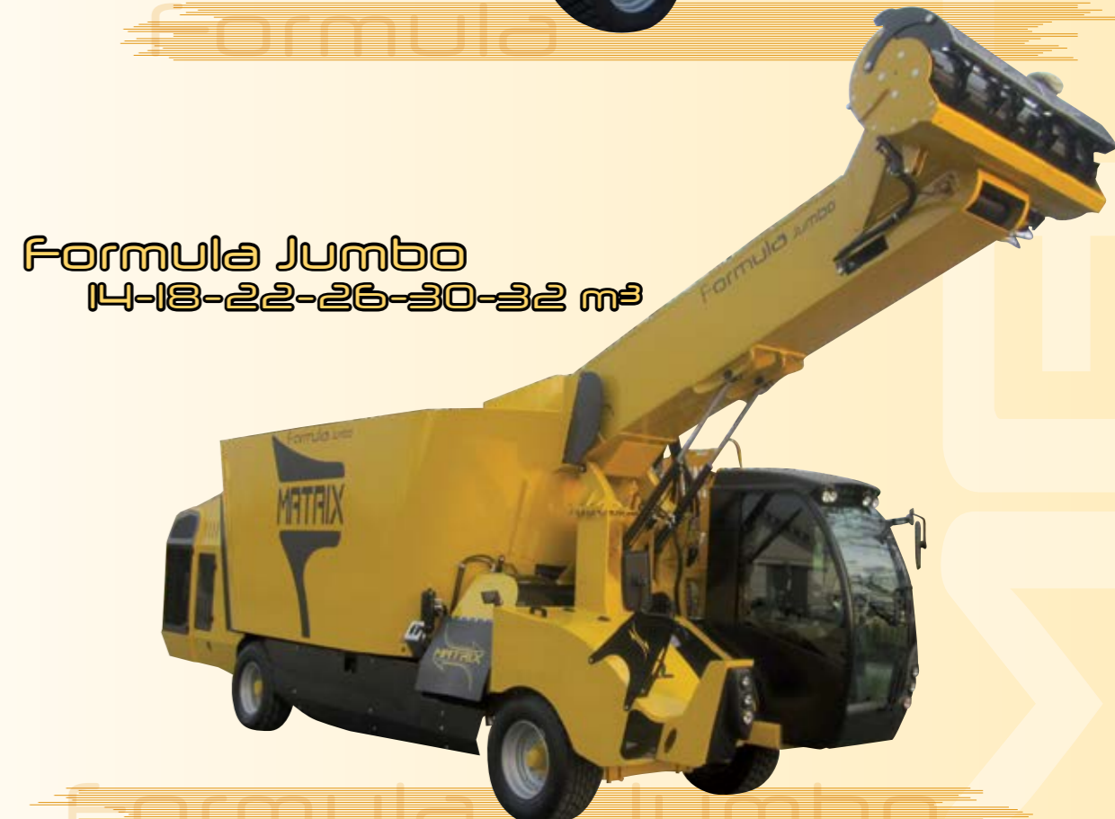
Formula Jumbo 14-18-22-26-30-32 m³