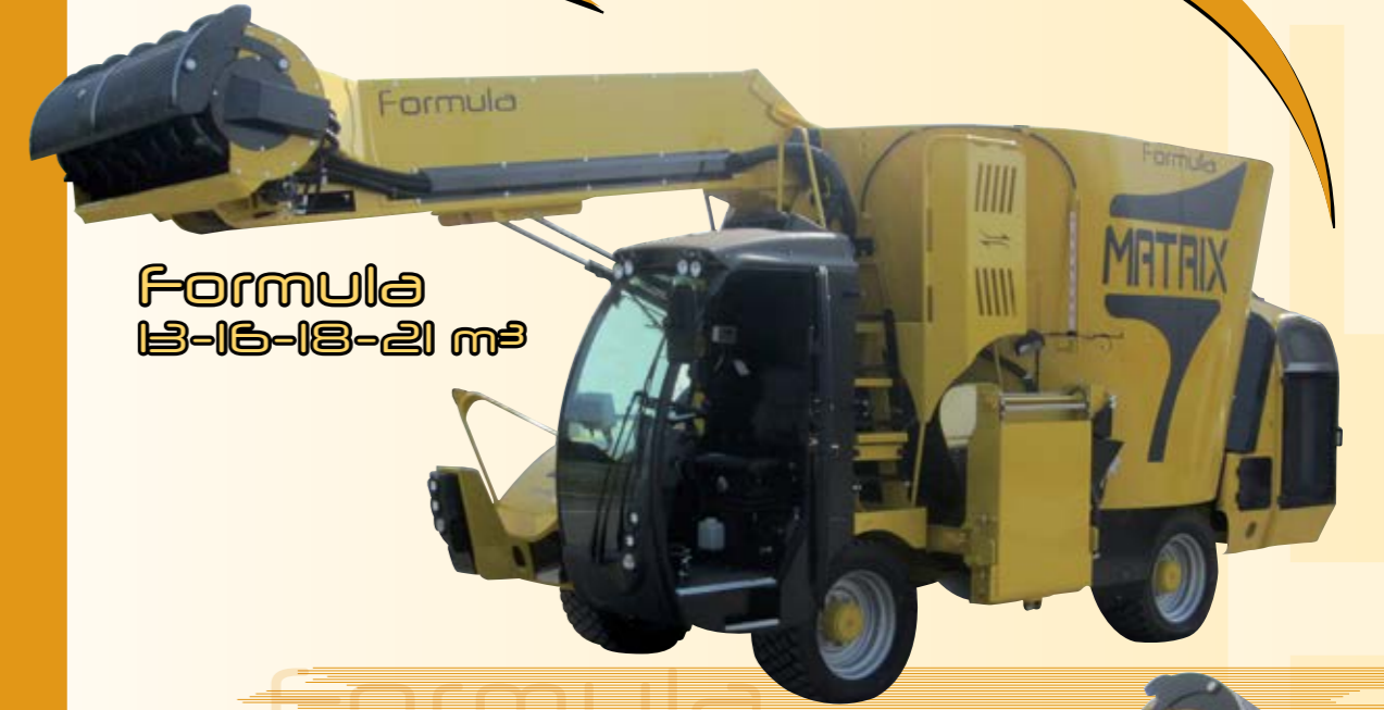
Formula 13-16-18-21 m³